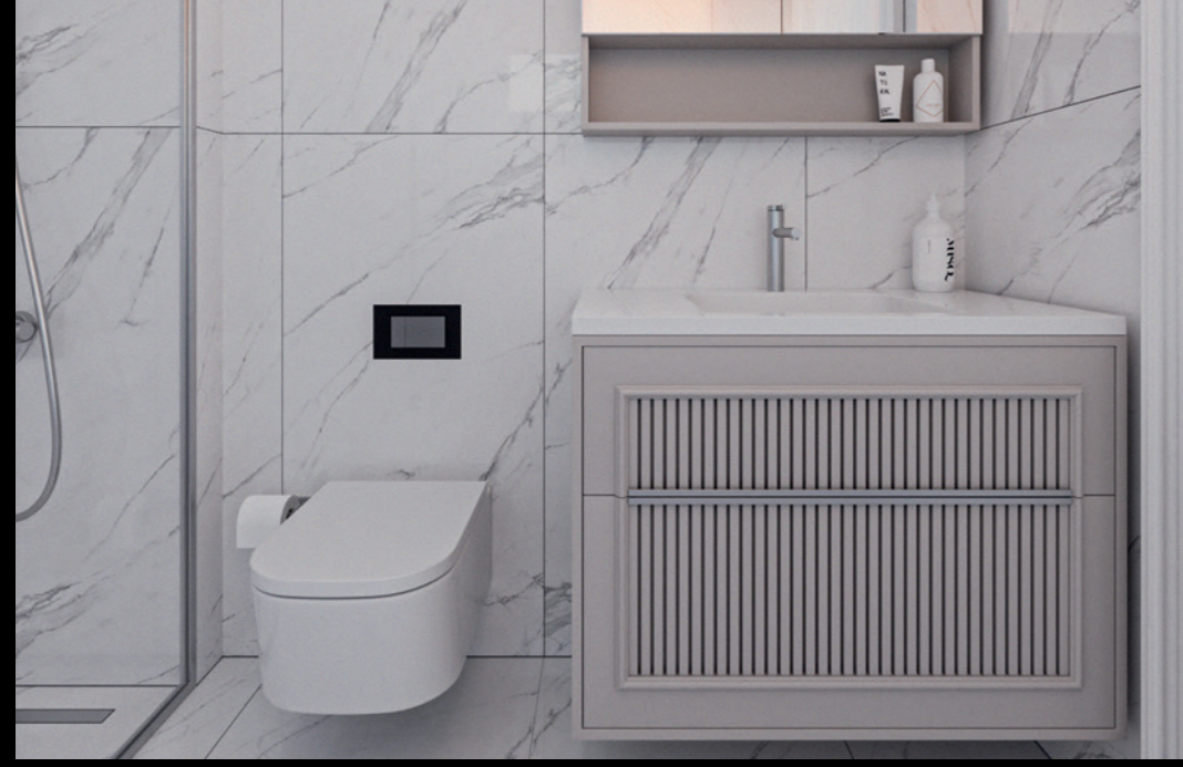
Her detaya yansıyan şıklık